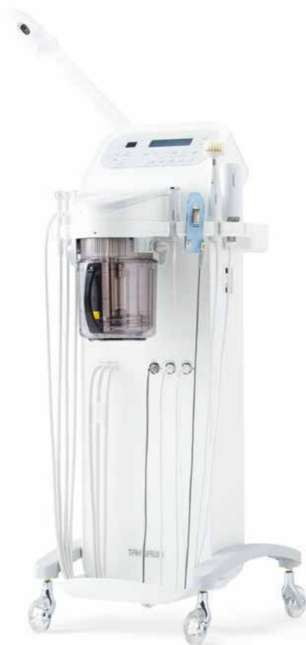
写真オプションフル装備： ピーリング・スプレー・バター・アイオニック・クール&ウォーム付

独自の技術により分子サイズを微細化するイオン化スチームが、肌の中までうるおいを届けます。また、アーム部分は角度の調整がスムーズに行え、ヘッド部分も回転させることができます。さらに、スチームの噴霧口が2つになっているツインノズルを採用。広範囲に安定したスチームを噴霧することができます。