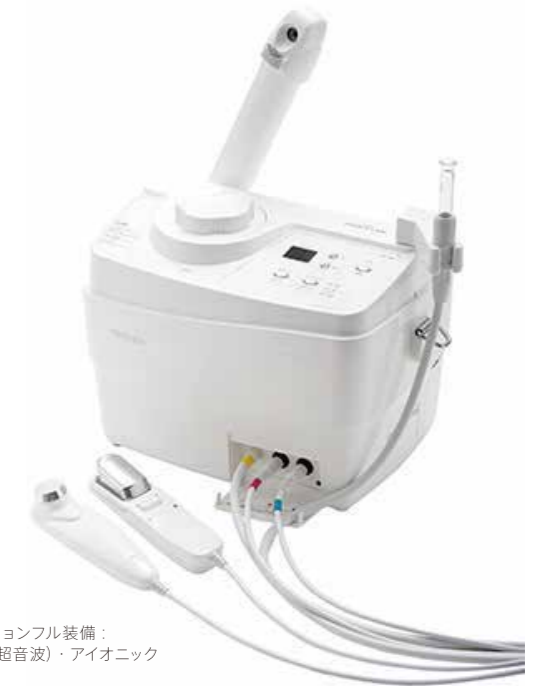
写真オプションフル装備： ソニック (超音波)・アイオニック

「グランキューブ」は、サロンで使用されているプロフェッショナル用フェイシャルエステマシンをサイズ、重量ともコンパクトにしたフェイシャル機器。小型軽量化の実現で、サロンのワゴンやちょっとしたスペースにも設置可能で持ち運びにも便利です。店頭品としても小型軽量なので、ご家庭でのスキンケアに化粧品と組み合わせてサロンのお客様にご提案いただけます。