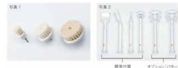
写真1 標準付属 写真2 オプション(バター)

お肌の不要な角質や汚れを、天然毛ブラシがやさしく取り除きます。手元のスイッチで ON・OFF が可能、回転方向と、回転速度を細かく設定できます。ブラシは3種の大きさを用意。